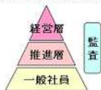
情報セキュリティ対策推進体制